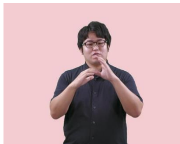
読み取り口述 「職場でのコミュニケーション」