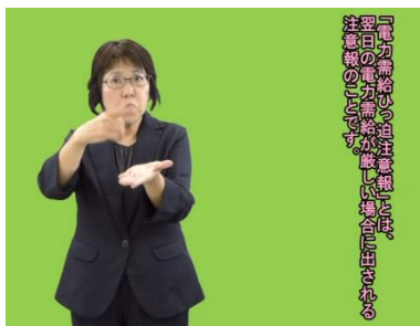
聞き取り表現 (音声のみもあり) 「電力需要の高まりと節電」 (手話通訳モデル)