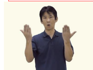
2022 年度 埼玉県准手話通訳者研修会 読み取り「大塚ろう学校の思い出」